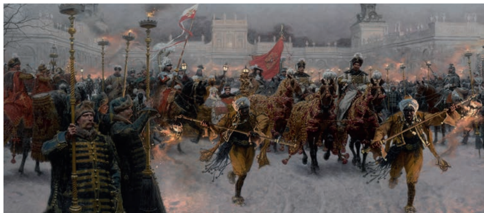
Józef Brandt, Départ du roi Jean III (détail) , 1887

L'exposition retrace ce moment si particulier de l'histoire de la culture polonaise, où malgré la division du pays entre l'Empire russe, l'Empire autrichien et le Royaume de Prusse, les artistes créent une véritable identité polonaise, ce que l'on a pu nommer depuis la « Polonité ». Elle présente la façon dont les artistes, en s'inspirant de l'histoire nationale, des paysages et de la paysannerie, ont façonné des images de la Pologne pour les Polonais mais aussi pour le reste du monde. Généreuse et évocatrice, leur peinture est souvent à la pointe des modes picturales européennes de l'époque. Grâce aux prêts prestigieux des musées nationaux polonais, l'exposition réunit environ 120 tableaux – datés entre 1835 et 1914 – des plus grands noms de la peinture polonaise, tels que Jan Matejko, Josef Chelmonski, Jacek Malczewski ou Wojciech Kossak.