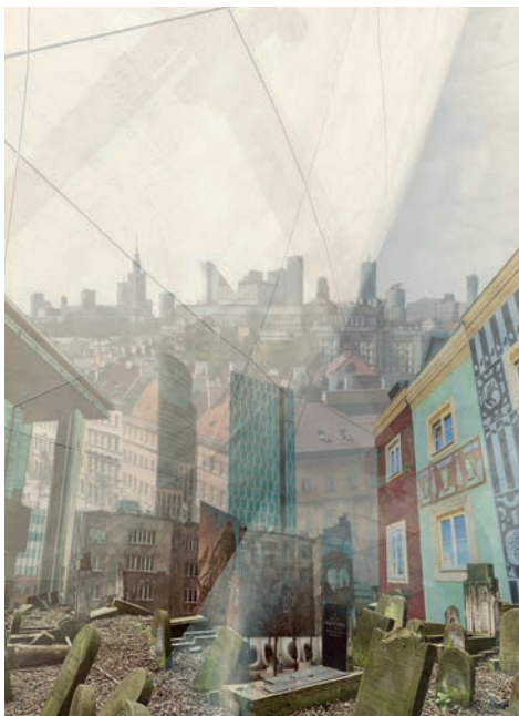
Trans-Polska sans titre

Au travers de textes extraits de pièces de théâtre, de nouvelles ou de romans, Cédric Le Maoût fera résonner les peintures de l'exposition Pologne avec la littérature polonaise. Sur fond de projections de photographies de la Pologne d'aujourd'hui et accompagné par l'ancien premier violon de l'ONL, Stephan Stalanowski, ils interpréteront des extraits d'œuvres musicales, allant du romantisme de Chopin à l'électro de la scène actuelle polonaise. Un spectacle « patchwork » pour faire résonner ensemble les arts polonais.