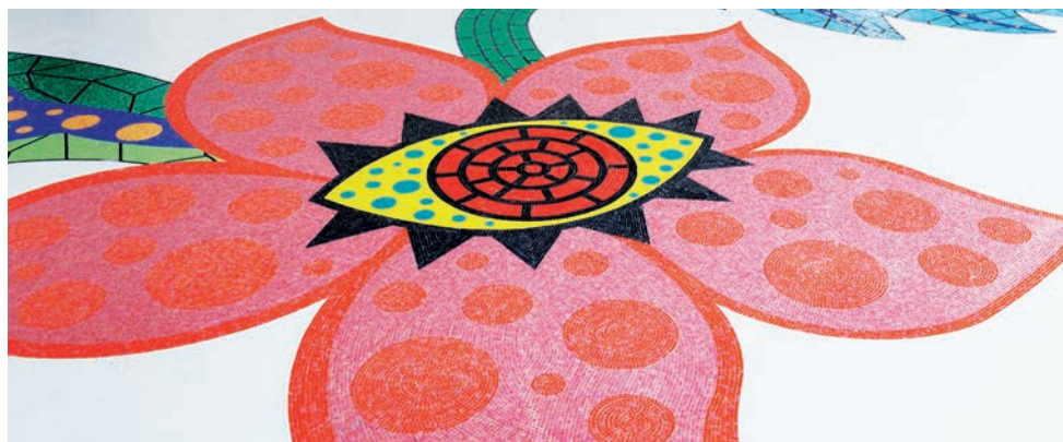
Yokoi Kusama, Flowers that bloom in the universe , 2012, mosaïque. Création originale pour la Scène du Louvre-Lens, commanditaire Région Nord-Pas-de-Calais. La mosaïque a été réalisée grâce au mécénat de Trend Group

Tarif unique pour les spectacles en séances scolaires : 5 euros par élève (-18 ans).