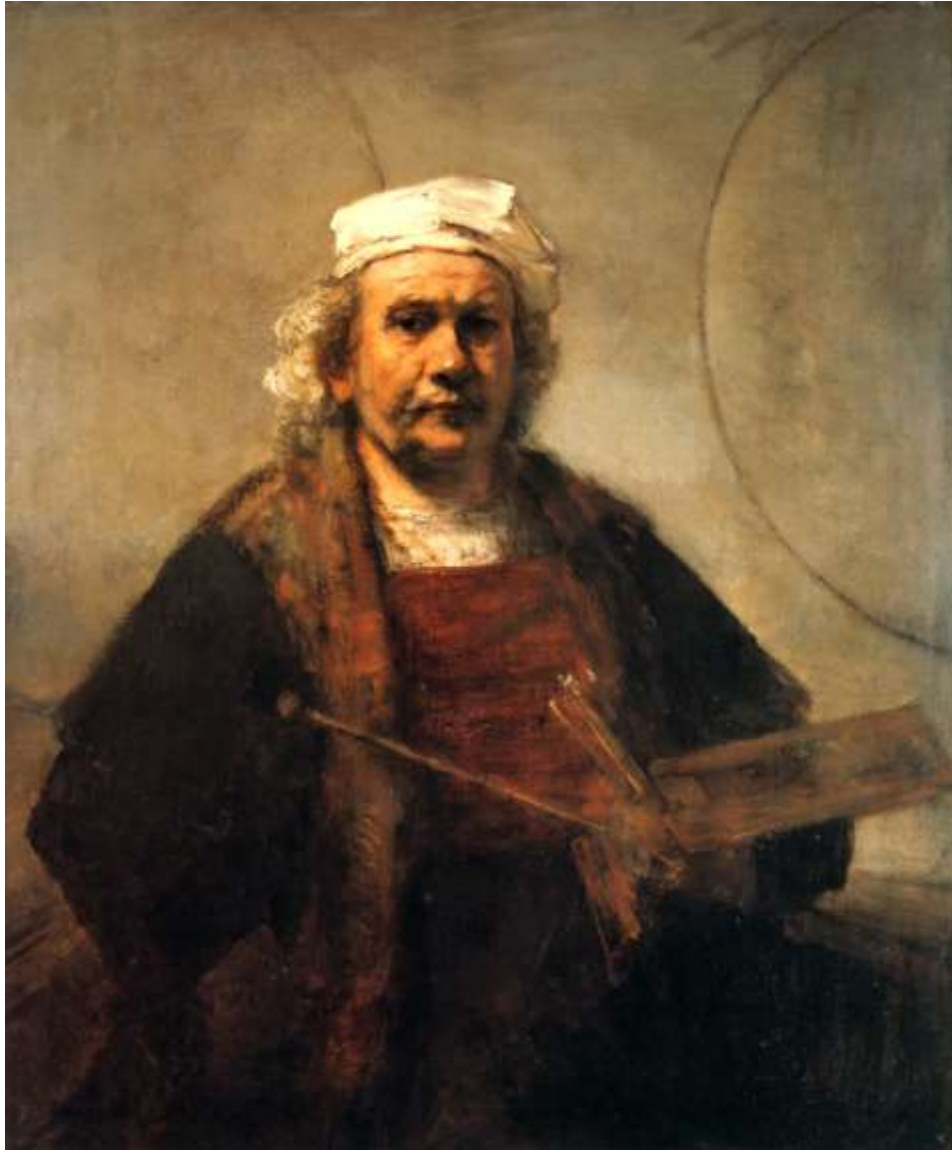
Rembrandt Harmenszoon Van Rijn, dit Rembrandt (1606-1669) Autoportrait , vers 1661 Huile sur toile English Heritage, Kenwood House, Londres