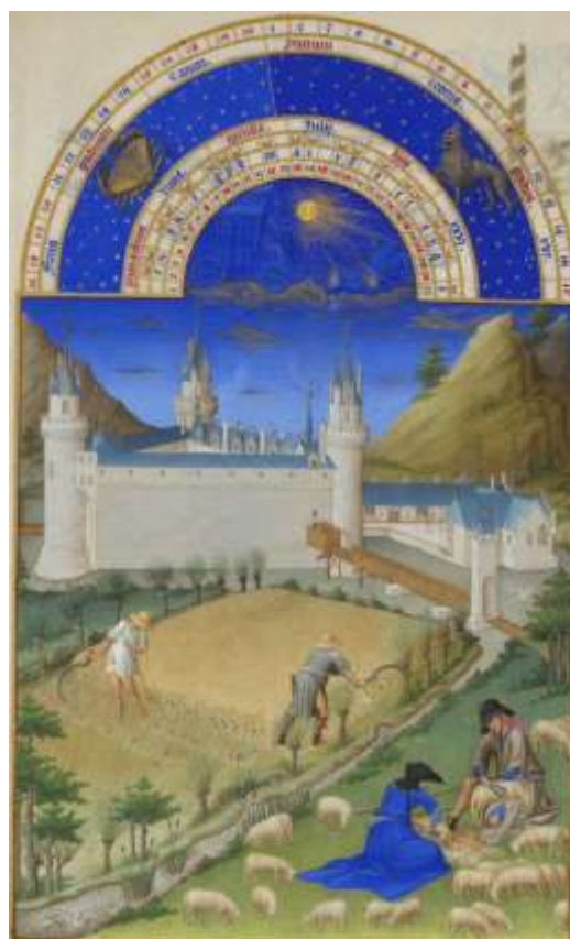
Les Très Riches Heures du Duc de Berry, Juillet, 1411/1416