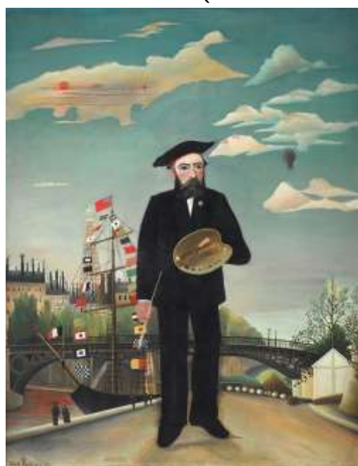
Henri Rousseau Moi-même, portrait paysage

Huile sur toile (1870) Narodni Galerie, Prague