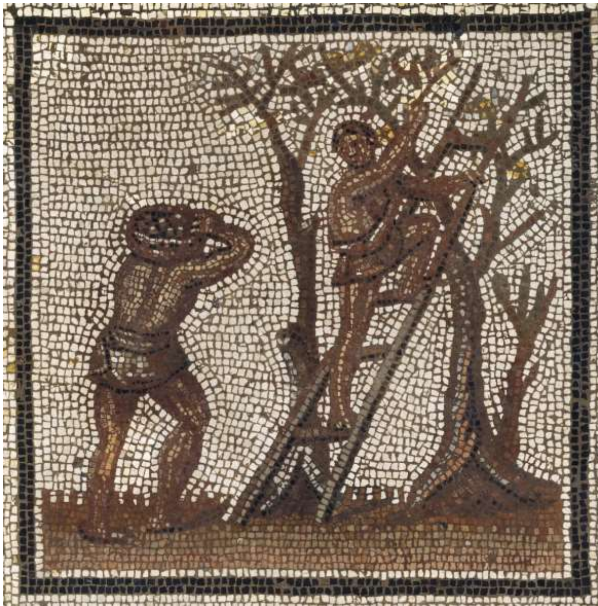
Mosaïque du calendrier agricole de Saint-Romain-en-Gal détail : "La cueillette des olives"